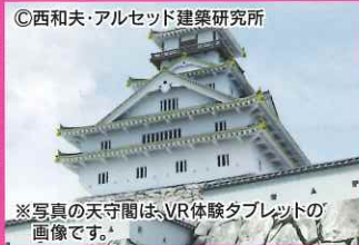
※写真の天守閣は、VR体験タブレットの画像です。